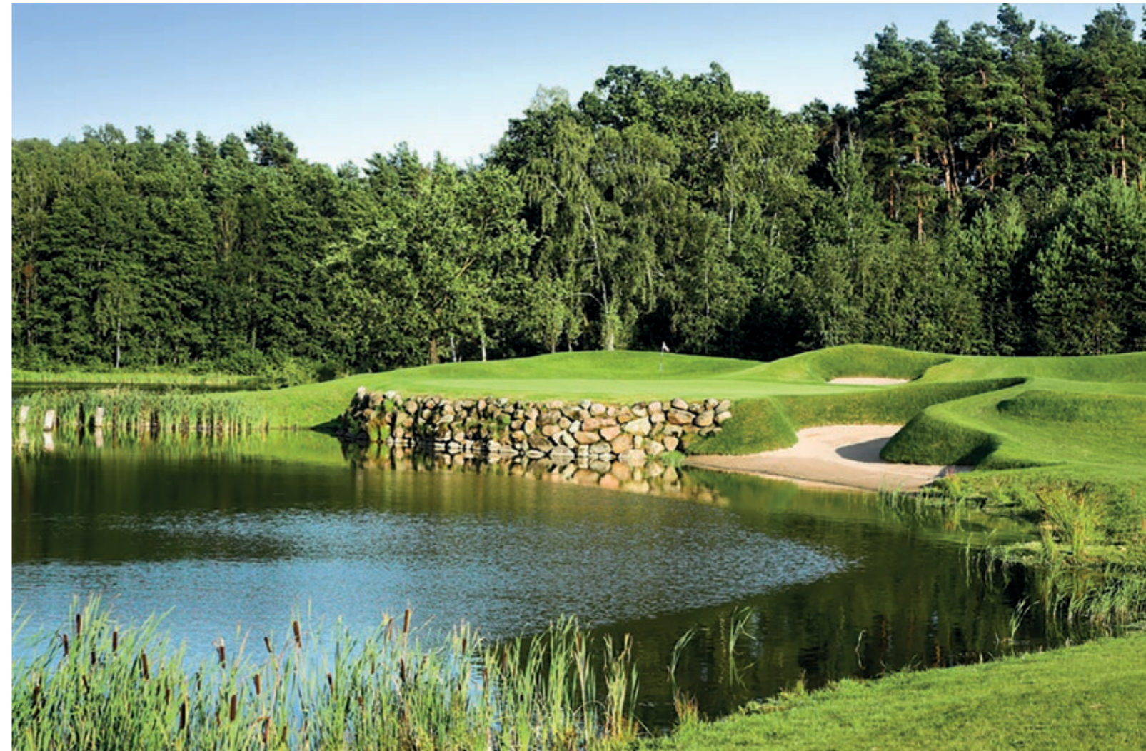
Det unike hull 15 på Modry Las.

DESIGNET ER TYPISK GARY PLAYER (JEG HAR SPILT MANGE AV HANS BANER, SPESIelt I SØR AFRIKA) MED NOE OPPHØYDE GREENER, STORE OG GODT SYNLIGE BUNKRE MED HØYE KANTER I SPILLERETNINGEN, OG MODERATE, MEN LETTERE ONDULERTE GREENER.