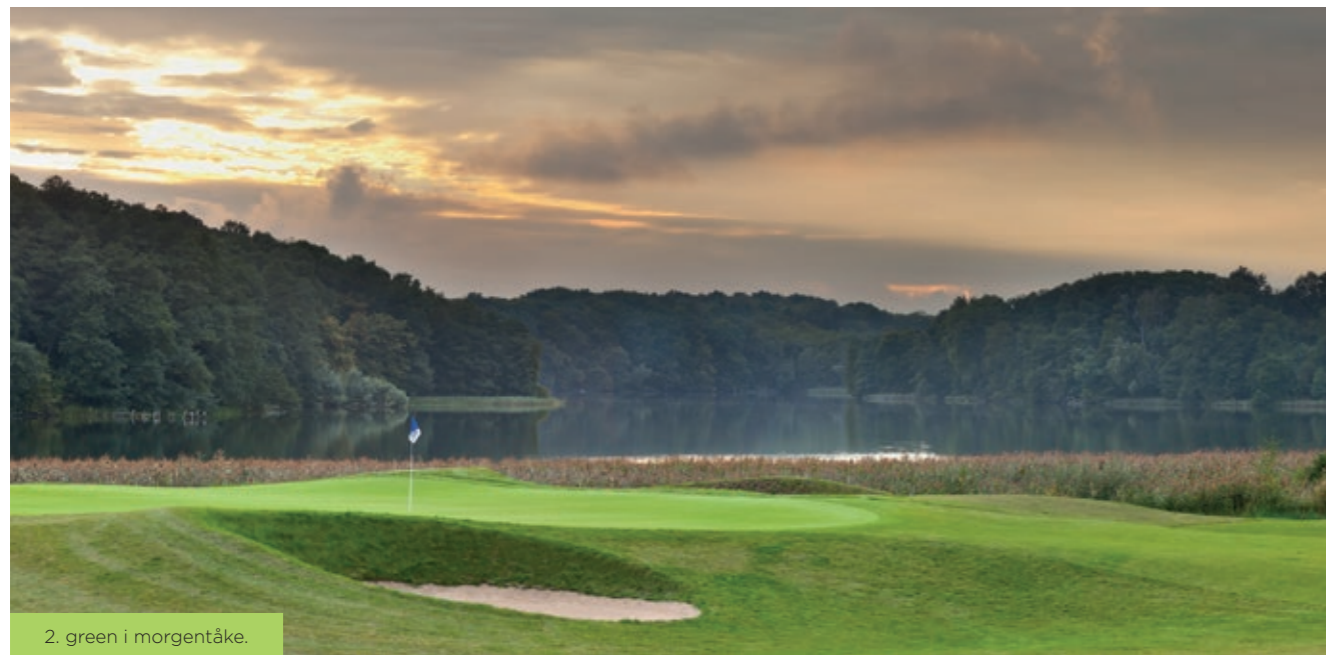
2. green i morgentåke.