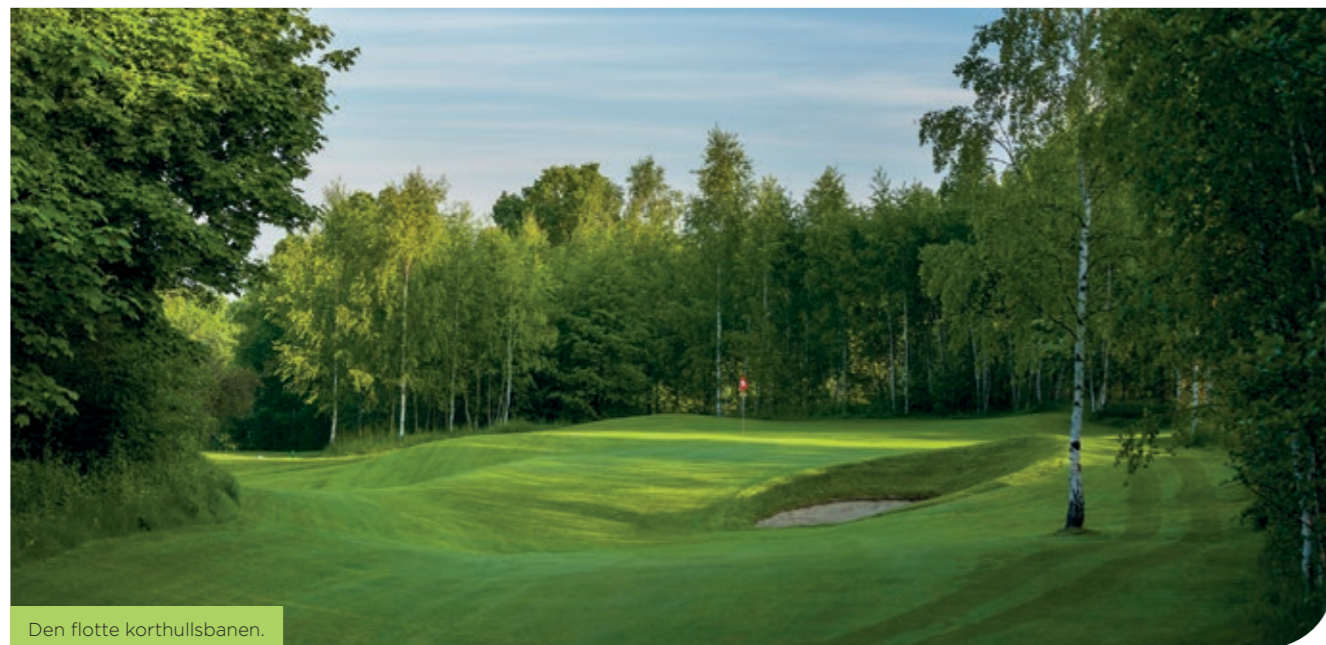
Den flotte korthullsbanen.