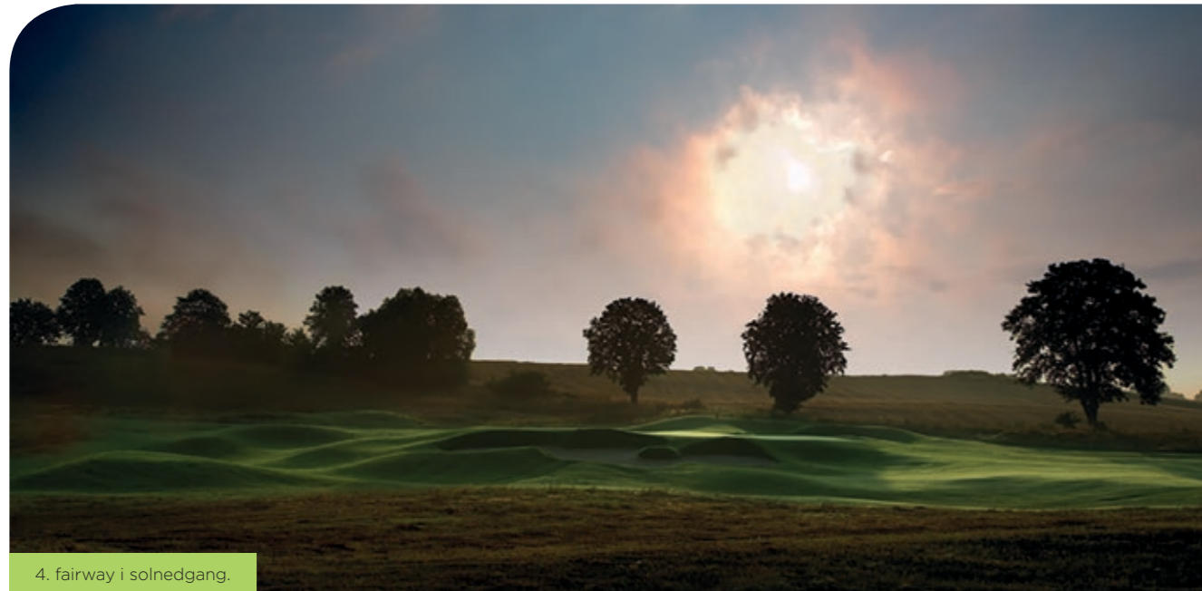
4. fairway i solnedgang.