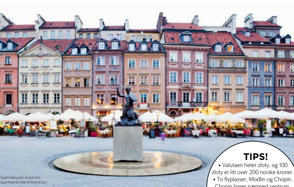
Gamlebyen med sin sjarmerende arkitektur.