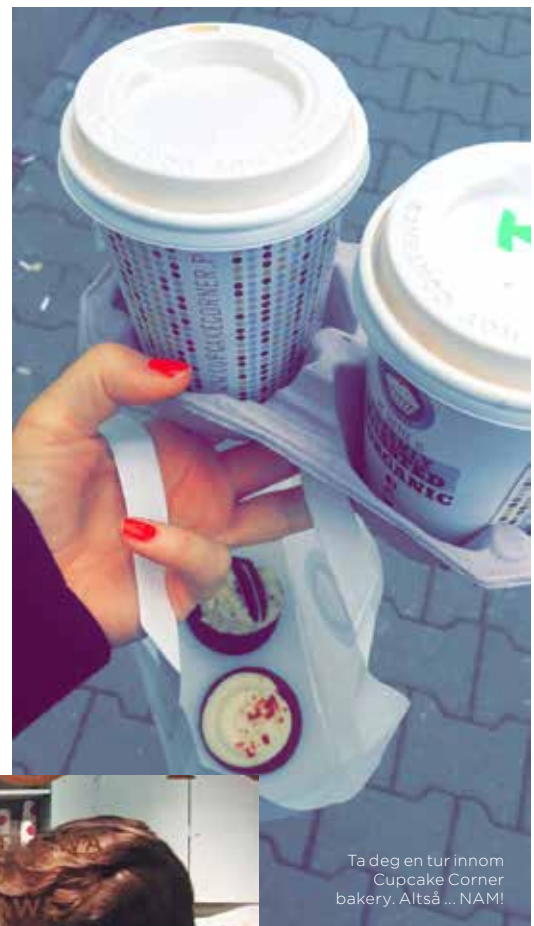
Ta deg en tur innom Cupcake Corner bakery. Altså ... NAM!

Noen ganger er sjokolade det eneste rette, og skulle lysten melde seg når du er i Warszawa, så ta turen innom Wedel. Nyt håndlaget konfekt og de deiligste sjokolade-dessertene du kan tenke deg. For ikke å snakke om kakaoen! Wedelpijalnie.pl/en