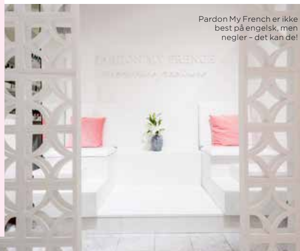
Pardon My French er ikke best på engelsk, men negler – det kan de!

Tre salonger, alle stilrent innredet. En manikyr med shellac her koster ca. 250 kr, med vanlig neglelakk koster det ca. 150 kr. De tilbyr også pedikyr, og har lang sofa du og venninnene dine kan sitte ved siden av hverandre i, mens føtter blir stelt og tær lakkert. Pardonmyfrench.pl