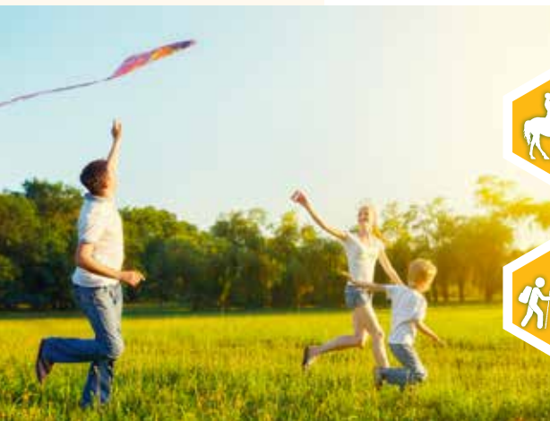
Gospodarstwo posiada trzy słoneczka wg kategoryzacji PFTW GG